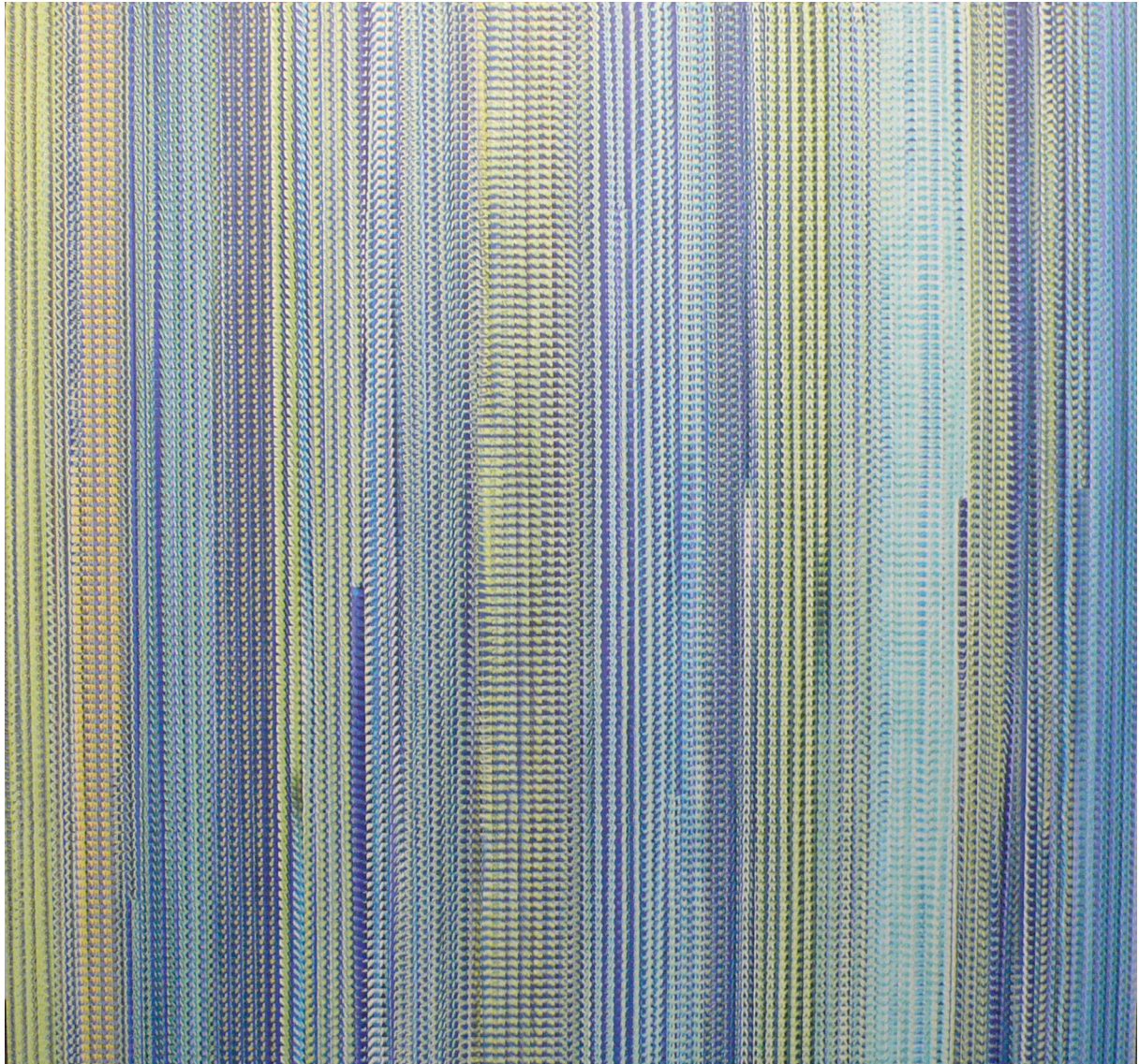
Sex im Wasser, 2009, Inkjet on canvas, 208 x 223 cm